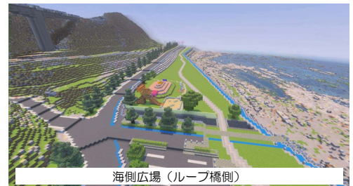
海側広場（ループ橋側）